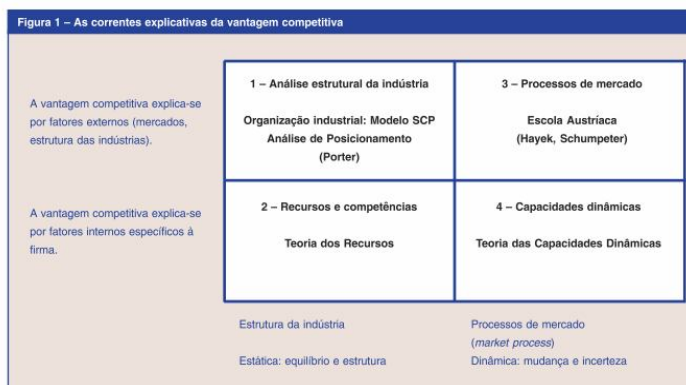
Figura 01: As Correntes Explicativas da Vantagem Competitiva Fonte: Vasconcelos e Cyrino, 2000, p. 23

Explicada a Vantagem Competitiva a partir das contribuições teóricas acima mencionadas, Vasconcelos e Cyrino (2000) ordenaram as teorias mediante a contraposição de dois critérios: a vantagem competitiva explicada pela (a) origem ou fontes (internas ou externas); e pelas (b) premissas sobre a concorrência (estática ou dinâmica). O modelo explicativo dos autores é ilustrado pela figura 01, abaixo.