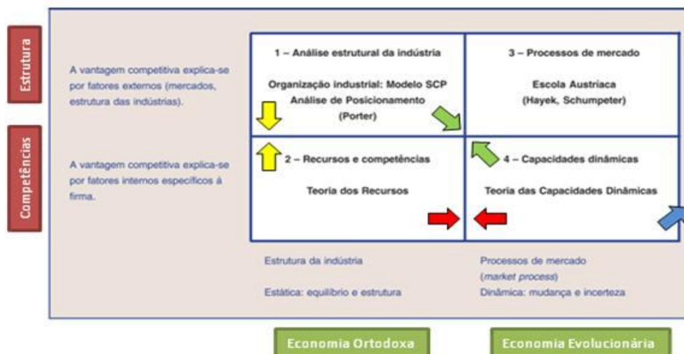
Figura 02: Evolução das Correntes Explicativas da Vantagem Competitiva

A figura abaixo apresenta uma proposta revisional dos critérios de classificação das teorias fundamentais da vantagem competitiva, bem como os movimentos evolutivos que serão discorridos na seção seguinte.