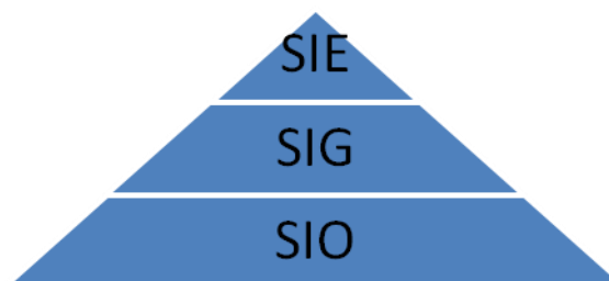
Figura 1 – Sistemas de Informação Empresariais

Os sistemas de informação podem ser classificados de acordo com a informação que será processada. Essa classificação geralmente é feita conforme a pirâmide empresarial, composta pelos níveis da organização, como mostra a Figura 1.