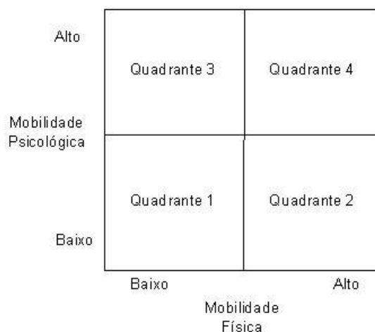
Figura 1 – Duas dimensões da carreira sem fronteiras

Os autores defendem que ter uma carreira sem fronteiras não se trata de possuir um ou outro tipo de mobilidade e sim das diferentes combinações desses dois tipos de mobilidade. Essas duas dimensões devem ser analisadas em um continuum. Para explicar esse conceito, eles apresentam a figura 1 que representa essas diferentes combinações em 4 quadrantes. A carreira sem fronteiras pode ser vista e operacionalizada pelo grau de mobilidade exibida pelo ator de carreira ao longo do continuum de mobilidade física e ao longo do continuum de mobilidade psicológica.