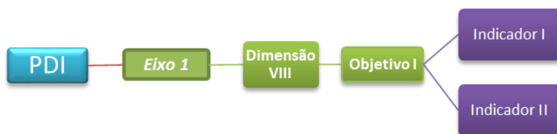
Figura 2: O desdobramento do PDI em eixos e dimensões

A Figura 2 demonstra um recorte da nova configuração do BSC da IES: