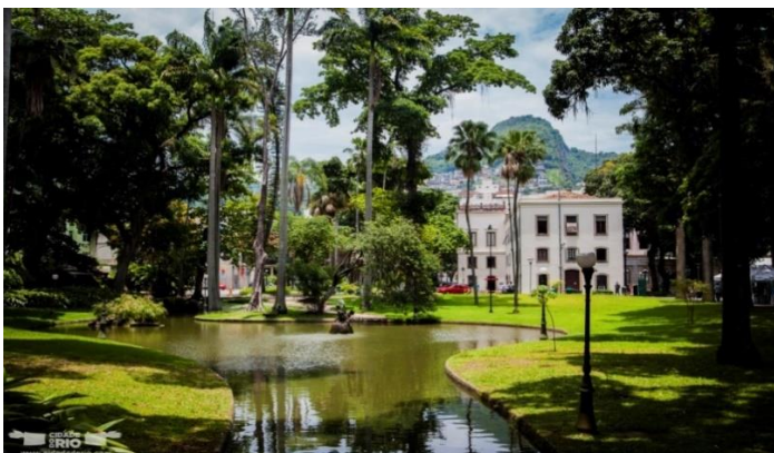
Figura 1: Jardim do Palácio do Catete