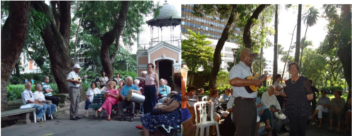
Figura 2: Seresteiros em apresentação